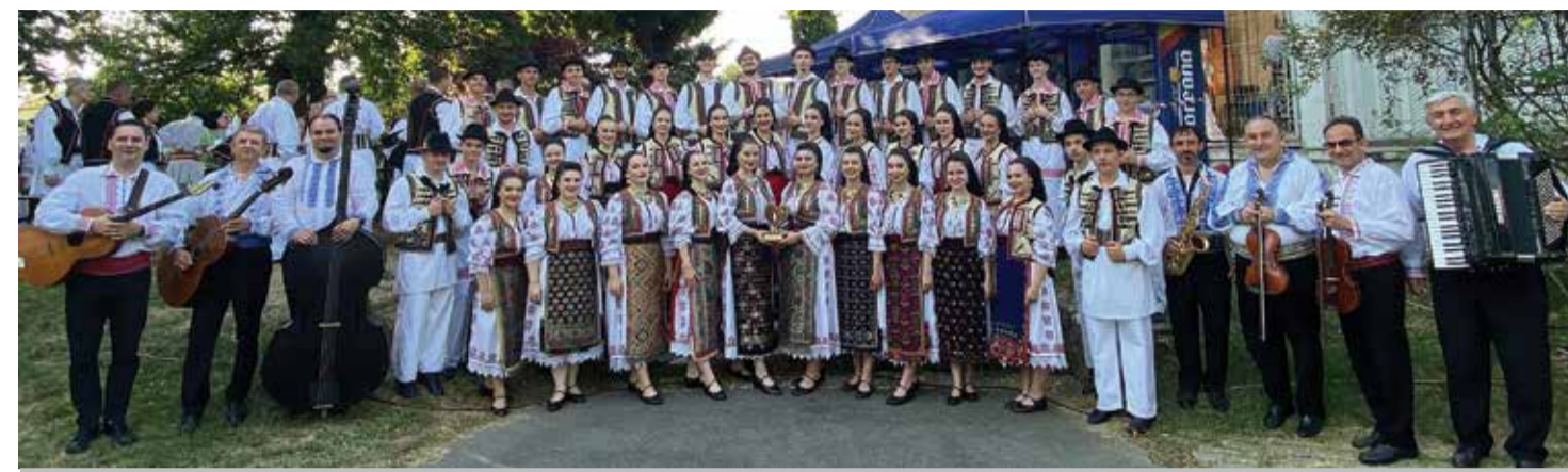
Ansamblul DOINA la Festivalul Inimilor

Grupul de dans german „Buntes Sträußchen” a participat în perioada 2-4 iunie la manifestarea cea mai importantă a etnicilor germani din zonă, la Zilele Culturale Germane din Banat, desfășurate în Timișoara. Aici au avut mai multe apariții în cadrul programului festiv, unde au purtat pentru prima