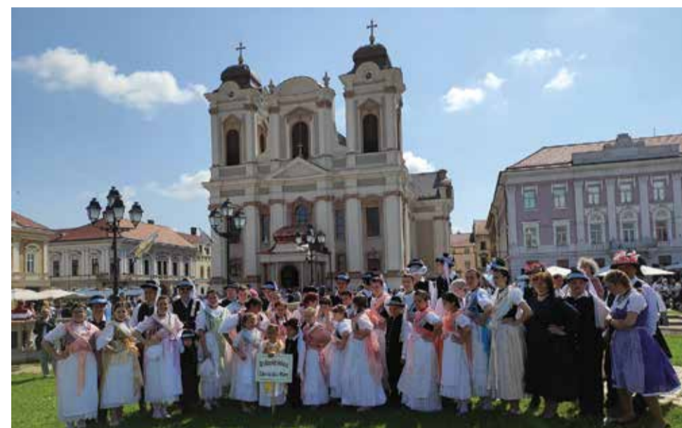
Grupul de dans german „Buntes Sträußchen” la Zilele Culturale Germane

Festivalul interetnic de folclor „Priamus” de a susține tinerii în promovarea și păstrarea tradițiilor.