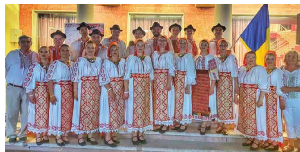
Ansamblul DOINA veterani în Albania la Festivalul Durres Music Fest