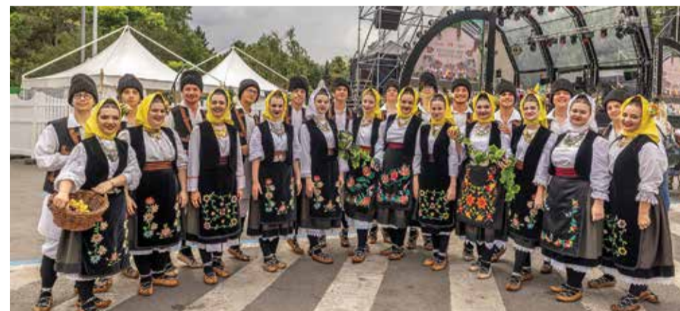
Ansamblul Sveti Sava la Festivalul internațional de folclor „Muzici și tradiții în București”